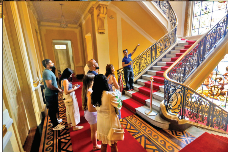
ESCADARIA principal do local, iluminada por vitrais históricos, é percorrida por visitantes durante a visita guiada

A visitação guiada é gratuita e atende, sem agendamento, até 10 pessoas. Para grupos maiores, é necessário entrar em contato pelo e-mail visitando.palacio@governador.ia.pe.gov.br para reserva. As visitas acontecem às quintas e sextas-feiras, das 9h às 11h e das 14h às 17h, e aos sábados e domingos, das 10h às 12h. Mais informações podem ser obtidas através dos telefones: (81) 3181.2171, (81) 3181.2367 e (81) 3181.2100.