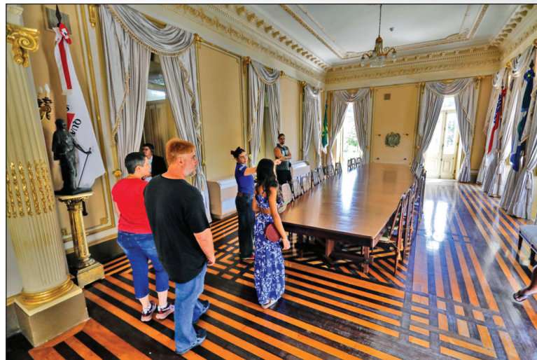
AMBIENTE interno da edificação reúne obras de arte, mobiliário histórico e elementos arquitetônicos