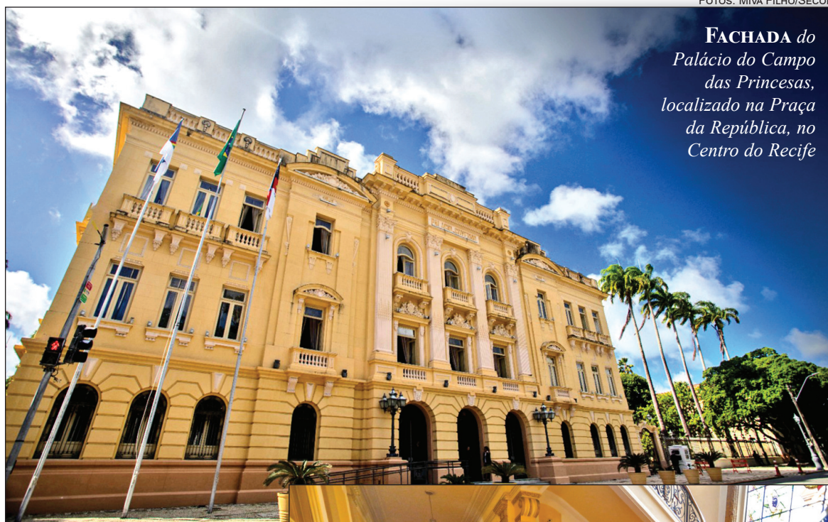
FACHADA do Palácio do Campo das Princesas, localizado na Praça da República, no Centro do Recife

Entre os ambientes do Palácio, destaca-se ainda um salão que reúne bandeiras de todos os estados brasileiros, responsáveis por batizar o espaço. Nas paredes externas do cômodo, estão dispostos dois brasões do Estado de Pernambuco. Ao final da visita guiada, o