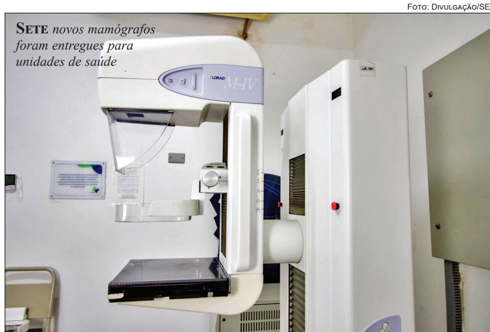
SETE novos mamógrafos foram entregues para unidades de saúde

“Essa aquisição representa um grande avanço na oferta de atendimento especializado pelo SUS em Pernambuco. Esse investimento garante ao Estado uma nova unidade de saúde de ponta, que contará com um tomógrafo de 64 canais e uma moderna sala de hemodinâmica, fortalecendo a assistência