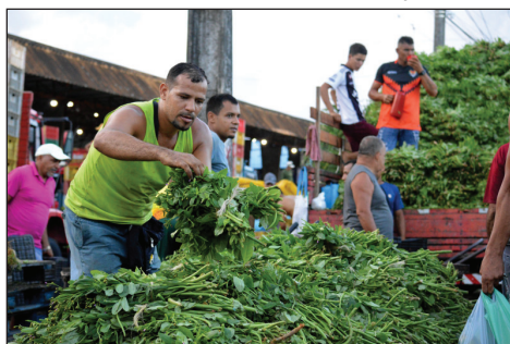
BREDO: expectativa é ultrapassar a marca de 180 toneladas comercializadas

A operação de logística, mobilidade e segurança, com o apoio da Polícia Militar, foi reforçada no Ceasa-PE. Entre os produtos oferecidos para a ceia pascoal, estão peixe fresco, leite de coco, coco ralado, cebola, arroz, azeite, alho e vinho. O entreposto ainda oferece uma variedade de ovos de Páscoa e chocolates. “São milhares de famílias vindo ao Ceasa-PE em busca de economia, qualidade e variedade, e também comerciantes e empreendedores que aproveitam esse período para reforçar o estoque e aumentar as vendas. Estamos preparados para receber