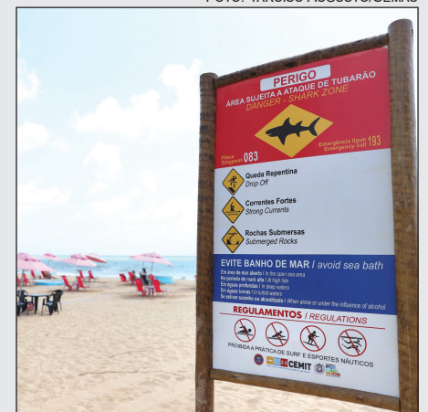
BANHISTAS devem ficar atentos

O Comitê Estadual de Monitoramento de Incidentes com Tubarões (Cemit) alerta a população da Região Metropolitana do Recife sobre os cuidados necessários para um banho de mar seguro no feriadão de Semana Santa e Tiradentes. De hoje a 20 de abril, será um período com lua cheia e os melhores períodos para um banho de mar seguro na Região Metropolitana do Recife ocorrerão entre 12h20 e 15h20, quando as marés estarão mais baixas, podendo formar piscinas naturais abrigadas por recifes. Essas piscinas serão cobertas pelas marés altas no início da manhã, entre 6h e 9h, e no final de tarde, entre 18h30 e 21h50, atingindo de 1,68m a 2,04m. Já a partir do dia 21 de abril, feriado de Tiradentes, com o início da Lua Minguante, a maré alta ocorre mais tarde, às 10h14 e às 23h14. Essa mudança reduz o risco de incidentes, já que os horários de maré cheia se afastam dos momentos de maior atividade dos tubarões. Nos trechos onde o mar é aberto, ou seja, sem