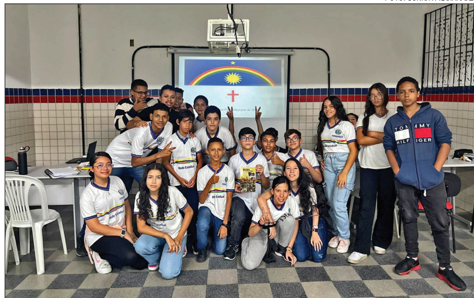
EM CARUARU , estudantes fizeram reflexão sobre cidadania, justiça e democracia