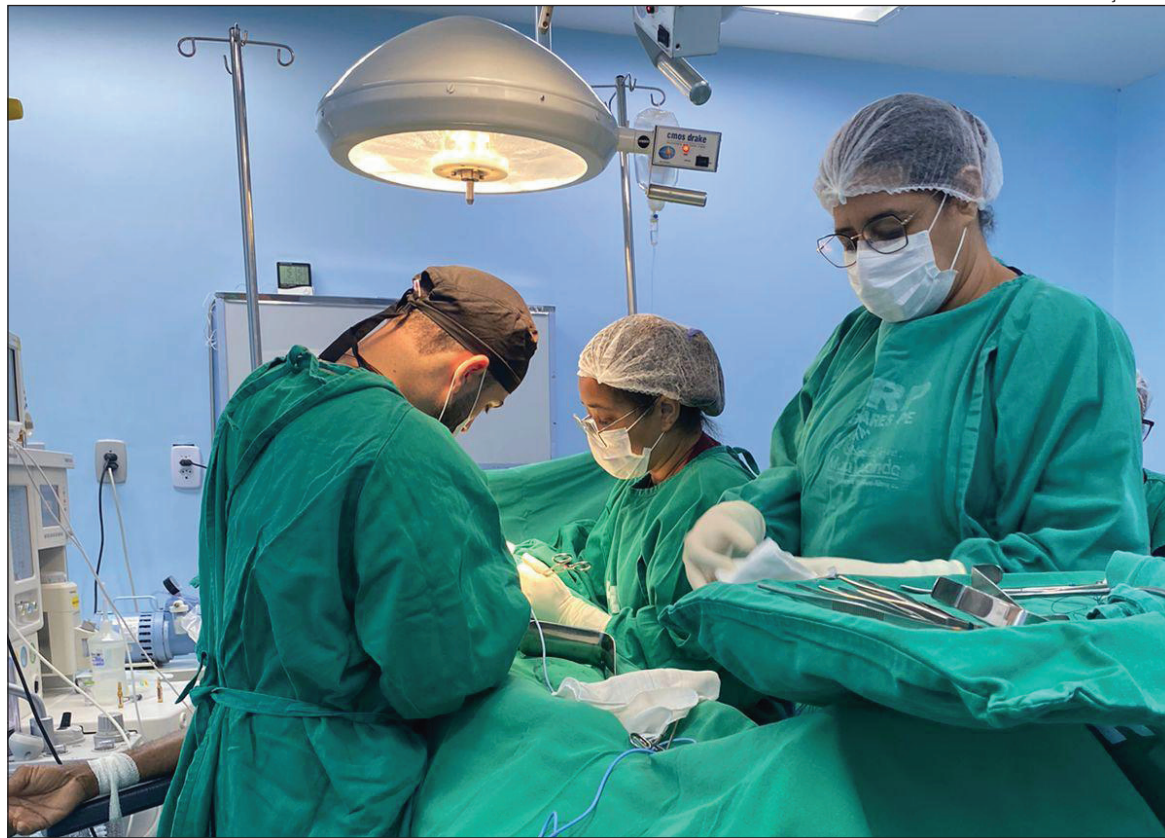
SERÃO realizados vários procedimentos, como laqueadura, vasectomia e cirurgias de joelho

O Cuida PE é uma importante iniciativa do Governo do Estado com o propósito de que mais pernambucanos tenham acesso a tratamentos cirúrgicos e especializados de forma mais ágil e eficiente.