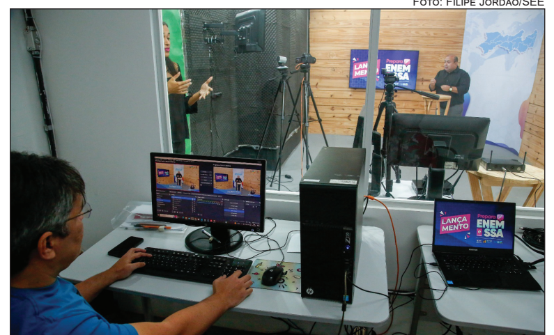
MAIS de 100 aulas serão disponibilizadas no YouTube

Em agosto, tiveram início as aulas do Pré Vestibular da Universidade de Pernambuco (Prevupe). Essa é uma tradicional parceria com a SEE que também contribui com a preparação dos estudantes que irão fazer o Enem. São 48 polos em escolas estaduais, que atendem 41 municípios distribuídos em todas as 16 Gerências Regionais de Educação (GREs).