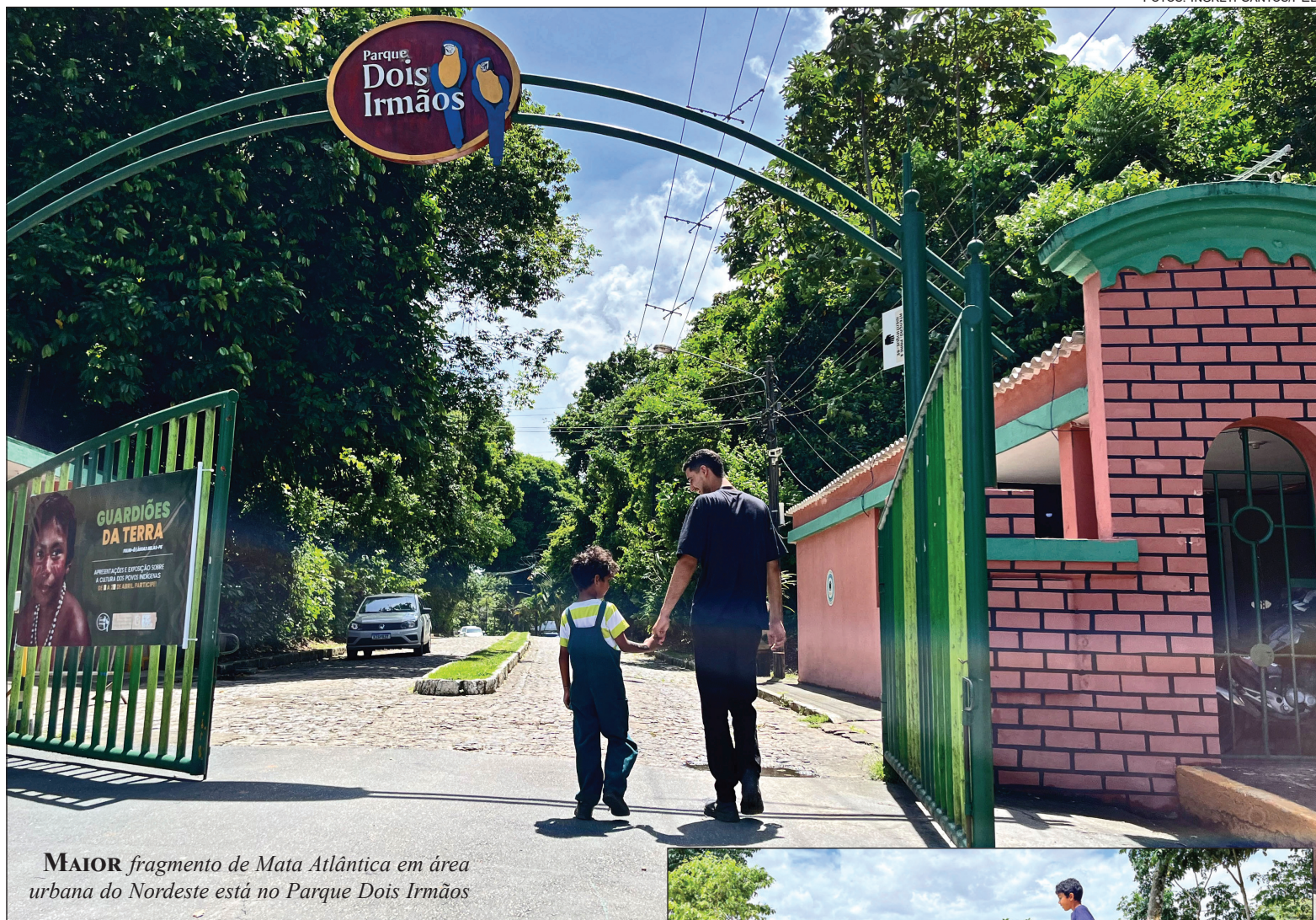
MAIOR fragmento de Mata Atlântica em área urbana do Nordeste está no Parque Dois Irmãos