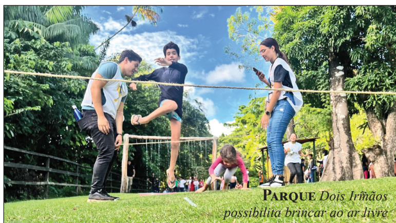
PARQUE Dois Irmãos possibilita brincar ao ar livre