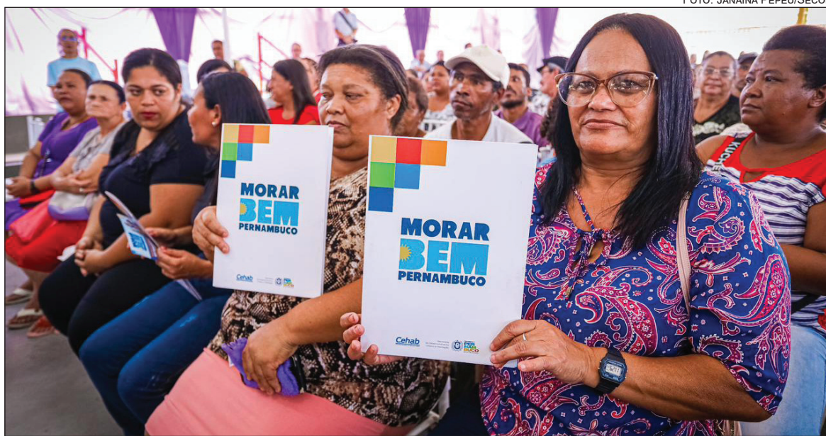
MAIS de 7 mil títulos de propriedade foram entregues desde 2023

A iniciativa faz parte do programa de Regularização Fundiária e Melhoria Habitacional (Regmel), do governo federal, que tem como agente financeiro, a Companhia Estadual de Habitação e Obras (Cehab), vinculada à Secretaria de Desenvolvimento Urbano e Habitação do Estado (Seduh).