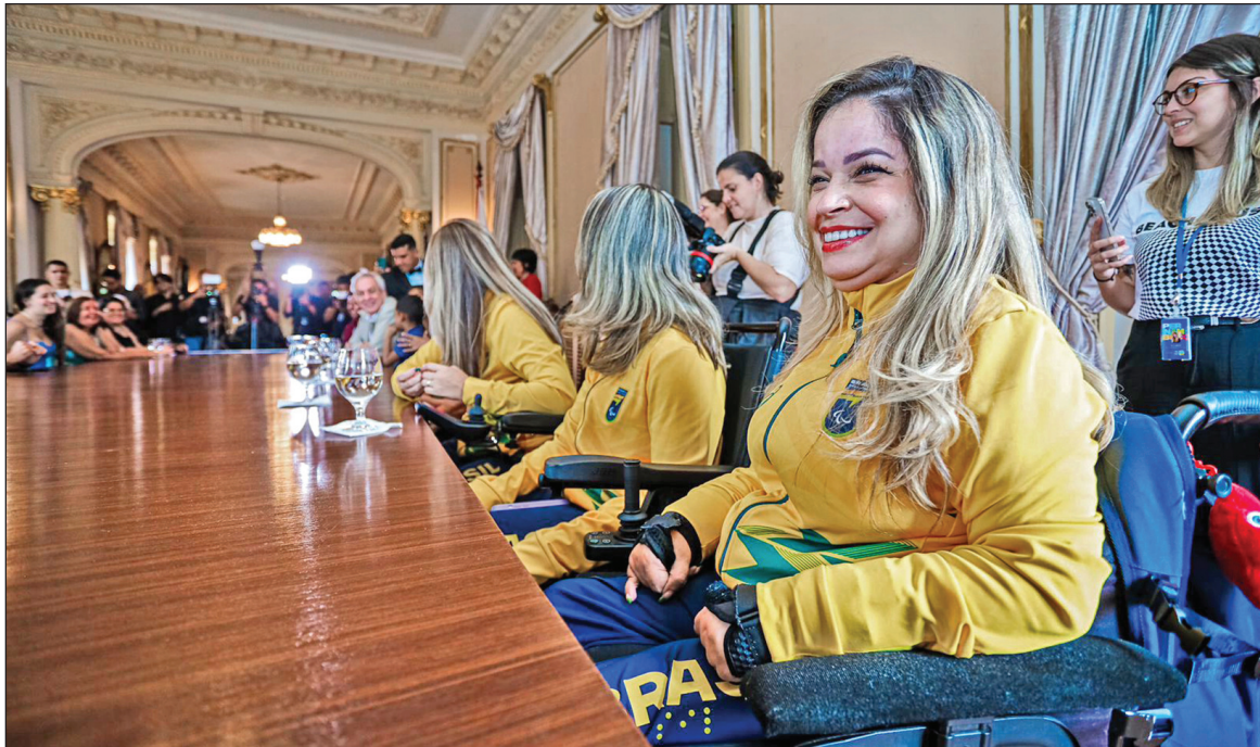
GOVERNO incentiva os atletas por meio do Bolsa Atleta Pernambuco, Time PE, Bolsa Técnico e Passaporte Esportivo