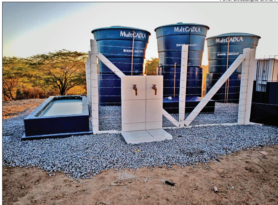
EQUIPAMENTO abastece uma população de cerca de 130 famílias