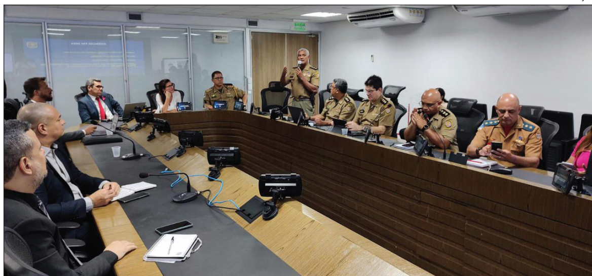
GT DEFINIU que próxima reunião terá presença dos clubes

Dentre os avanços do GT Futebol neste ano de 2023, destacam-se o alinhamento com os clubes, a implantação da operação Medina, a