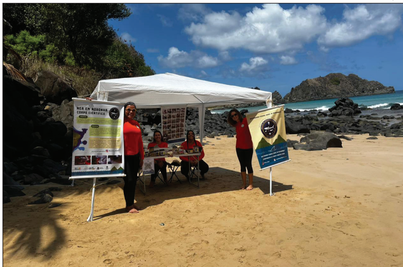
ECOTUBA também promove ações educativas

O objetivo principal do projeto, no entanto, é contribuir para o levantamento de informações que possam au-