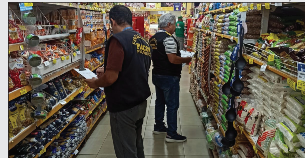
FORAM pesquisados os preços de 27 itens em 24 estabelecimentos

Realizada nos últimos dias de outubro, a pesquisa da cesta básica feita mensalmente pelo Procon-PE registrou uma queda de 1,65% em relação à pesquisa de setembro, totalizando uma dedução de R$ 10,46. A cesta básica passou de R$ 633,53 para R$ 623,07.